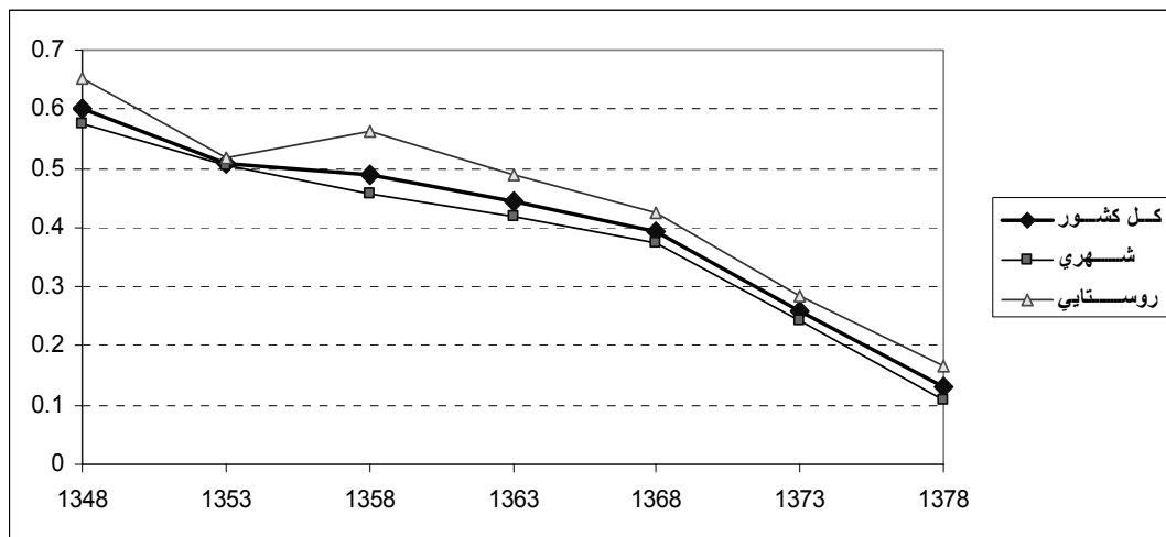
نمودار شماره ۱- مقایسه روند نسبت زنان ازدواج کرده ۱۹-۱۵ سال بر حسب محل سکونت