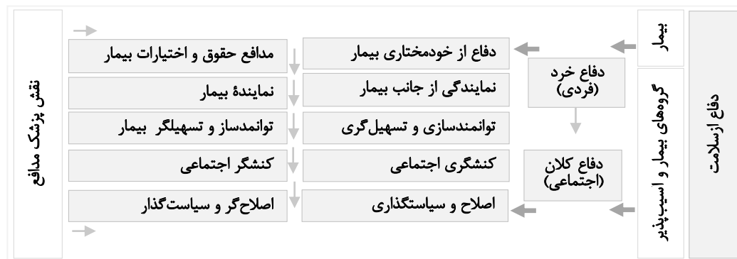
شکل ۲: نوع‌شناسی دفاع از سلامت و نقش پزشک مدافع