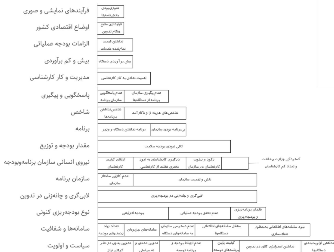
شکل ۱: نمای کلی از مضامین (یافته‌های پژوهش)