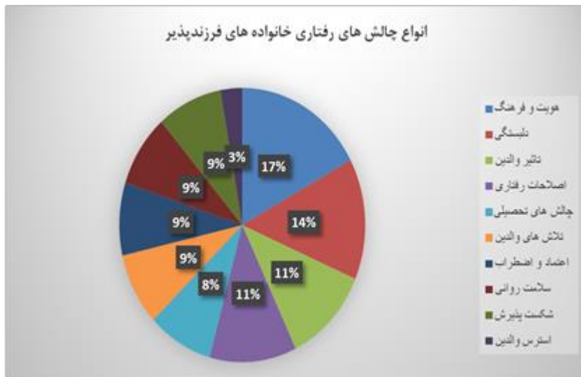
نمودار ۲: انواع یافته های مرتبط با چالش های رفتاری پذیرفته شدگان در خانواده های پذیرنده