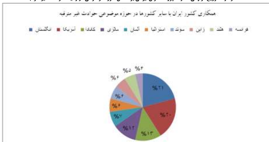
نمودار ۳. همکاری پژوهشگران ایرانی با سایر کشورها در حوزه موضوعی حوادث غیر مترقبه