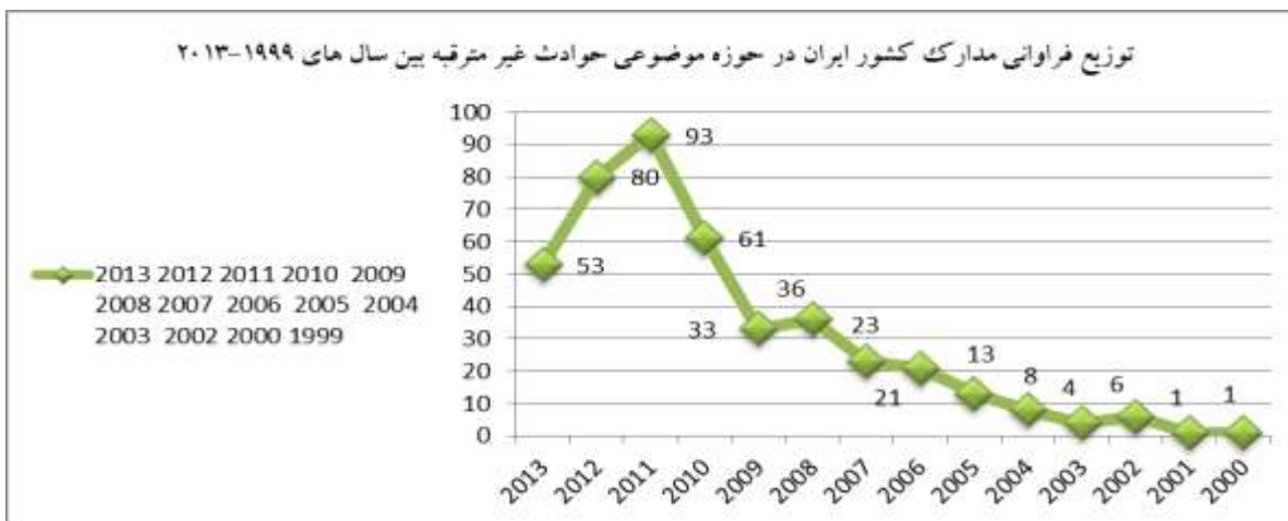
نمودار ۱. توزیع فراوانی مدارک پژوهشگران ایرانی در حوزه موضوعی حوادث غیر مترقبه بین سال‌های ۱۹۹۹-۲۰۱۳