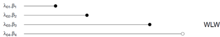
شکل ۳. مجموعه خطر، تابع خطر پایه ( \lambda_{0j} ) و ضرایب رگرسیونی ( \beta_j ) در مدل WLW