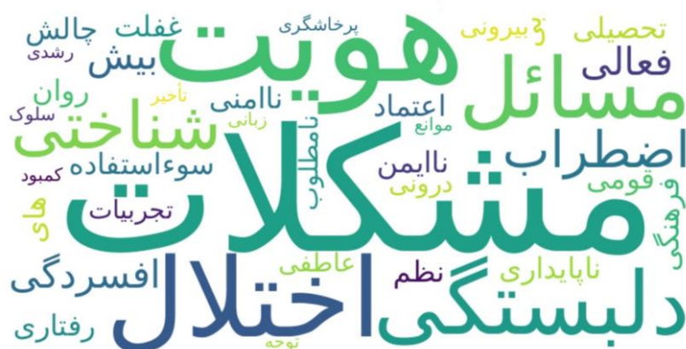
شکل ۱: خروجی ابری پایتون ون ۴ بر مبنای پرتکرارترین مشکلات و اختلالات کودکان فرزند خوانده