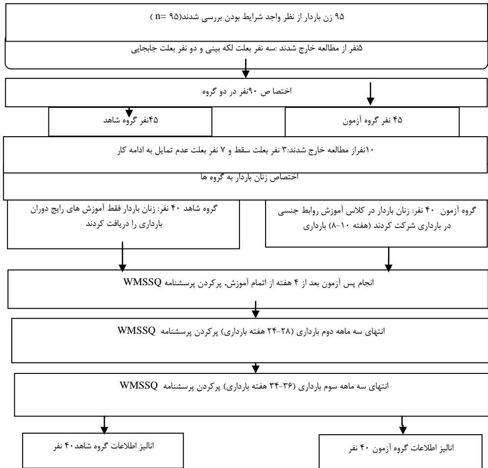
شکل ۱: نمودار مشارکت در مطالعه